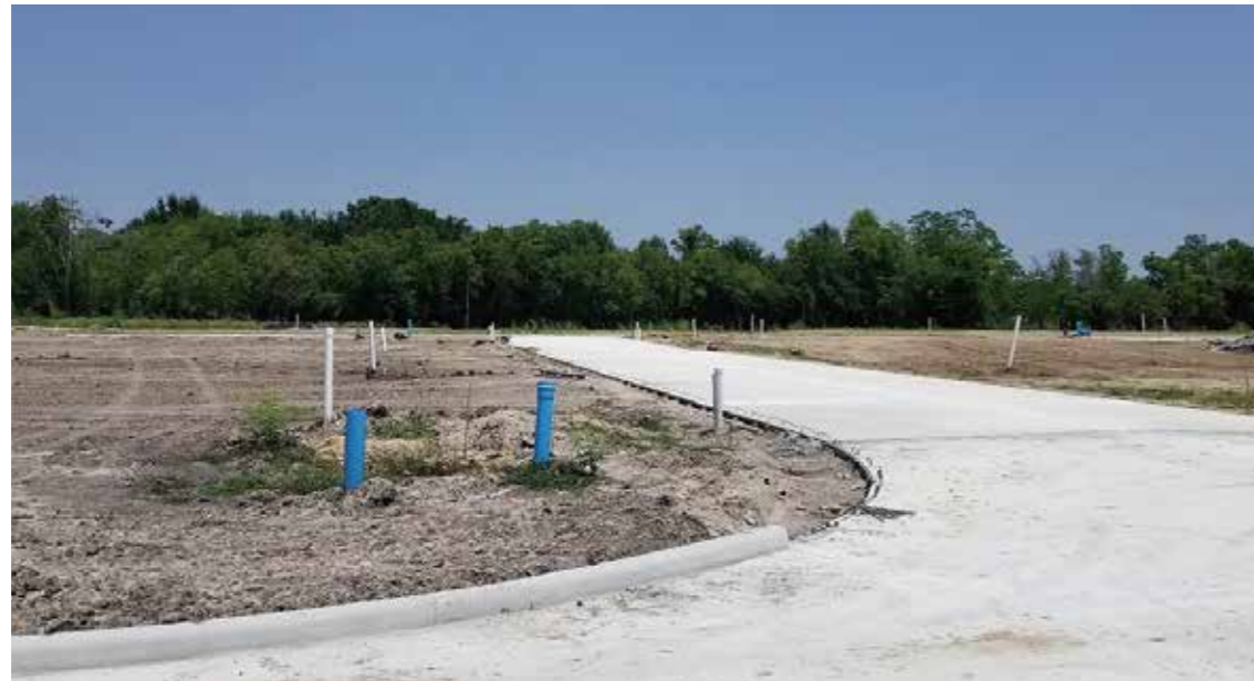
项目图集 - 2018 一进度照片