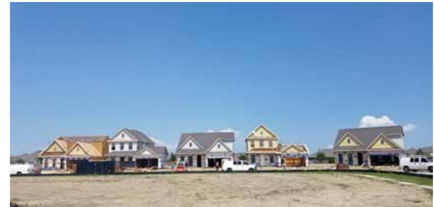
项目图集 - 2018 一进度照片