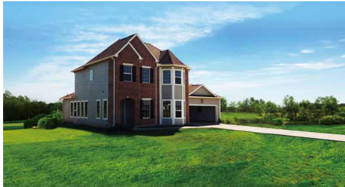
项目图集 - 2018 一样板间